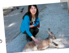
発表を終えてオーストラリアの自然を満喫