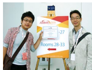
受賞後に窪田助教（阪大第一口腔外科、右）と